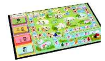
SST ボードゲーム 『なかよしチャレンジ』

※初めの頃は言葉で説明することが難しく、「わからん」とすぐに言ってしまいがちでしたが、繰り返し取り組む中で絵の状況や適切な話し方等じっくり考え表現できるようになってきました。