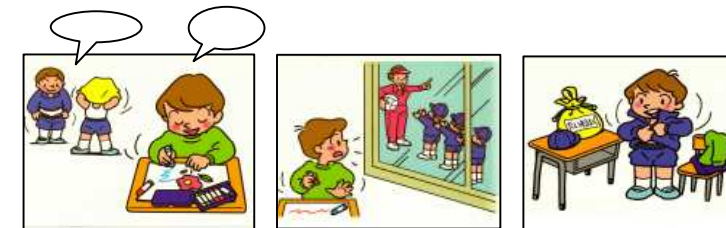
『ソーシャルスキルトレーニング絵カードことばと発達の学習室M 編・著』

状況に応じた言動のコントロールが難しい子どもたちとの取組。絵カードやすごろく等使って、「こんなとき、どうする?」「こんなとき、何て言う?」等、言葉で考え表現する学習を行いました。